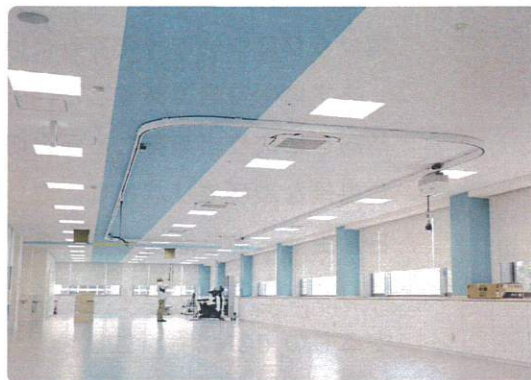
天井はブルーで貼り分け。 柱に色をつける事で柱間の距離がわかりやすい。