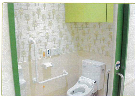
森林浴のイメージのトイレ

床材や腰壁にはお掃除しやすいタイルやパネル材を使用しても腰から上の方は壁紙を使用することが可能です。大分リハビリテーション病院では自然の中でリハビリをというコンセプトに合わせて植物の柄物クロスを用いて楽しく行きたくなるトイレを目指しました。