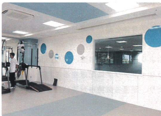
壁に丸い形を飛ばしてアクセントに

患者さんがリハビリで歩行する部分は他の床と色を変えたり、一步の目標距離が認識できるようにラインを設けました。デザインされた目標物が床や壁にあると目線の高さや歩幅など共有しながらリハビリできると好評を得ています。