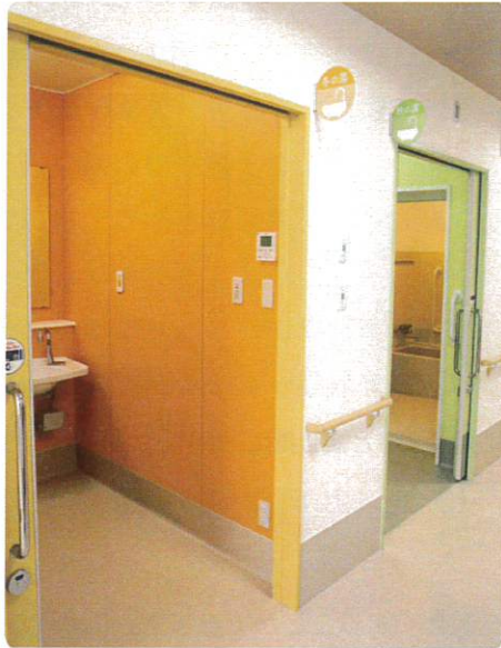
冬の湯・秋の湯 脱衣室