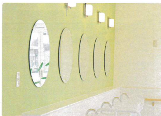
鏡も丸くすると楽し気に