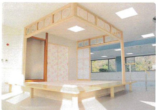
和室をリハビリ室の一角に