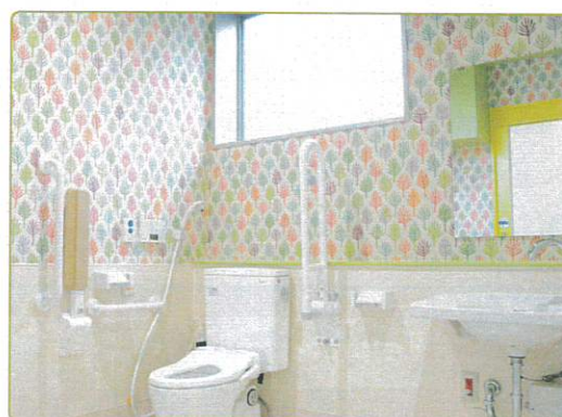
カラフルな森のイメージのトイレ