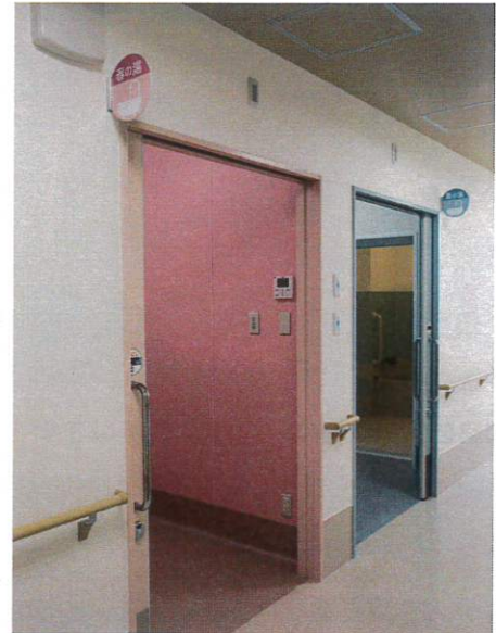
春の湯・夏の湯 脱衣室